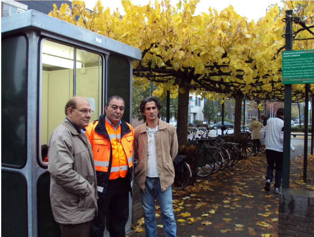
De bewaakte fietsenstalling in Bussum

De pilot zou kunnen starten met de vrijdagmiddag, vrijdagavond en zaterdag, als meest drukke winkeldagen, een en ander in overleg met de winkeliersverenigingen.